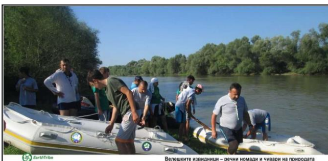
Велешките извидници – речни номади и чувари на природата

промена за слободно и одговорно инклузивно општество со акцент на развиениот рурален туризам како алатка за промоција на младите и останатите граѓани во општествените процеси во носењето на одлуки, ќе се креира простор за слободно