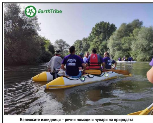
Велешките извидници – речни номади и чувари на природата

извидници сместени во пет чамци. Велешките извидници сакаат да ги идентификуваат и можните и потенцијалните загадувачи на реката Вардар на овој потег. Овие 34 километри воден пат за 24 извидници воедно беше и можност за спортско-рекреативни активности од типот на пливање и веслање наменето за младите извидници. Во текот на веслањето ќе се постават и 15 еко табли со еколошки попраки кои треба да ја зголемат еколошката свест на сите кои се движат по брегот на Вардар.