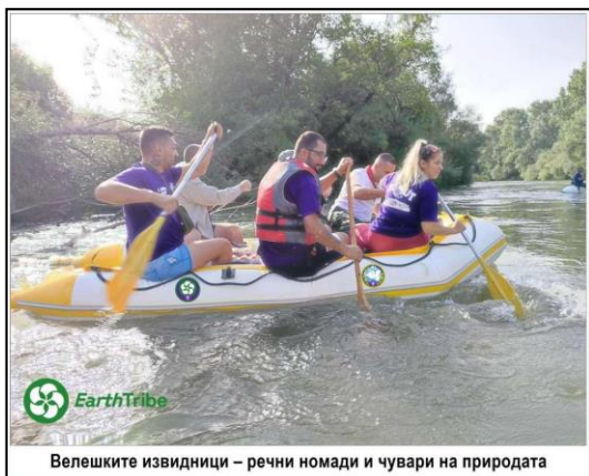
Велешките извидници – речни номади и чувари на природата

Во периодот од 3-4.10.2025 год. Велешките извидници кои се нарекуваат речни номади и чувари на природата ја реализираа мини регатата преку која младите извидници стануваат лидери преку зајакнување на локалните институции и придонес во заедницата и јакнење на нивната врска со нивните конституенти и граѓаните и општествено одговорни лица во промоцијата на слободата на изразување, човековите права и интеграцијата како и двигатели на промена за слободно и