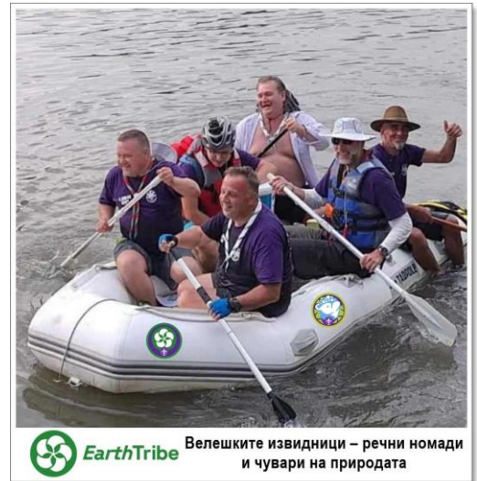
Велешките извидници – речни номади и чувари на природата

Оваа активност е во рамки на глобалната иницијатива Champions for Nature Challenge и проектот Green Skills Rising, Сојузот на извидници на