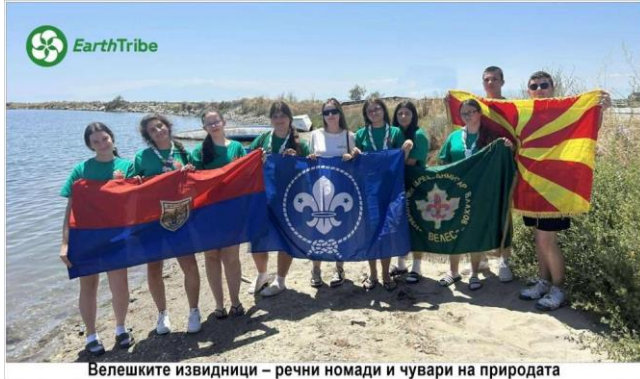
Велешките извидници – речни номади и чувари на природата

Оваа активност е во рамки на глобалната иницијатива Champions for Nature Challenge и проектот Green Skills Rising, Сојузот на извидници на